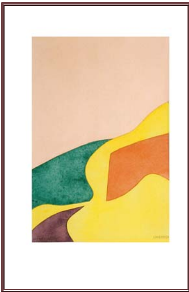
1976 Cat.461 hyeres.4.76 Aquarel / Papier 390 x 240 mm

Copyright 2008 H.A.F.A. de Kat, NL-3766HX.40