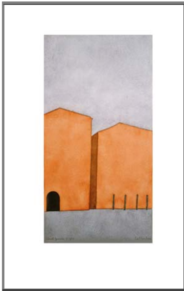
Cat. 277 Canal Grande 5.1962 Aquarel / Papier 310 x 248 mm

Anton A.C. Labberton (1904-1987) was een compromisloze kunstenaar, die vanuit zijn koffers en met zijn schilderskist in eenvoud leefde voor zijn kunst. Als een reizende eenling trok hij door Europa en Noord-Afrika, waar hij het landschap en karakteristieke stadsgezichten in ongewone abstracties van licht, kleur en vorm aquarelleerde. Elke aquarel is sterk bepaald door de atmosfeer ter plekke en het coloriet van het seizoen.