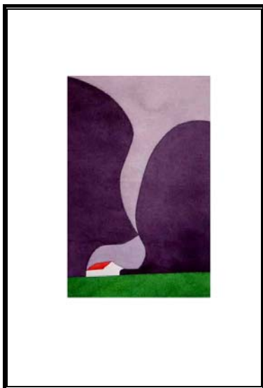
1979 Wassenaar 4.'79 Aquarel / Papier 383 x 245 mm

Stedelijk Museum, Amsterdam Gemeentemuseum, Den Haag Kunsthalle, Bielefeld (D) Museum, Bochum (D) Kunsthalle, Bremen (D)